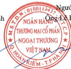
Phó Tổng Giám đốc